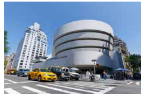
Guggenheim in New York